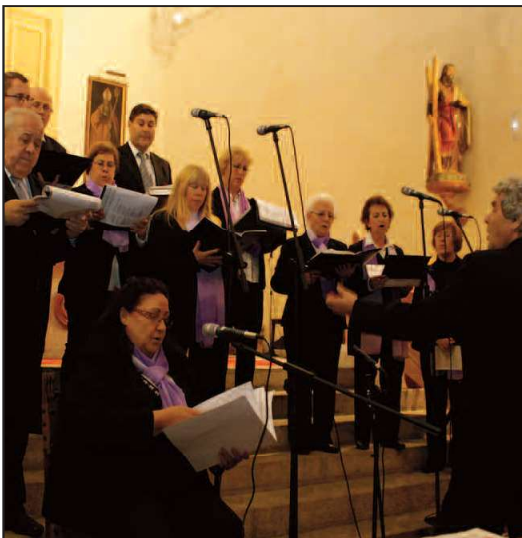
Festival de Villacincos en Rascafría.