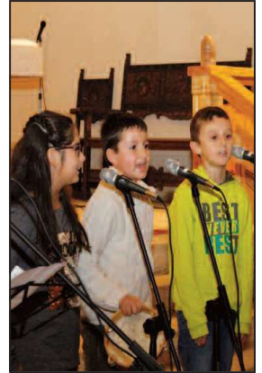
Festival de Villancicos en Rascafría.