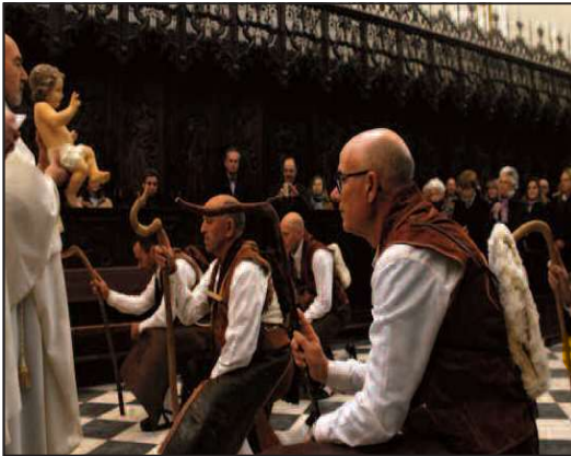
La Pastorela de Braojos en el Monasterio de El Paular.

han registrado grandes afluencias de gente para disfrutar de estas representaciones. El esfuerzo de los actores, a pesar del frío y de