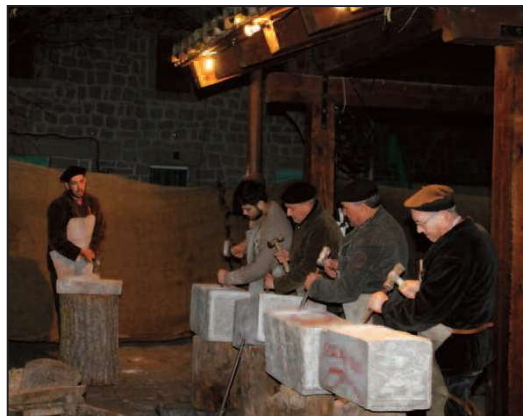
Belen Viviente de El Berrueco.