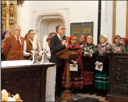
La Pastorela de Braojos en el Monasterio de El Paular.