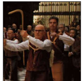
La Pastorela de Braojos en el Monasterio de El Paular.