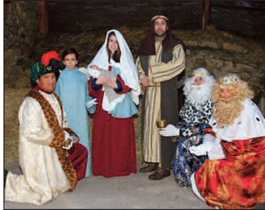
Belen Viviente de El Molar.