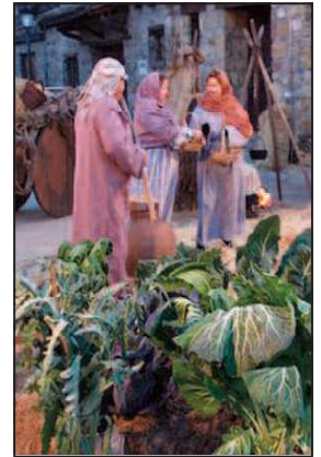
Belen Viviente de El Molar.