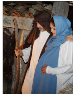
Belen Viviente de El Berrueco.